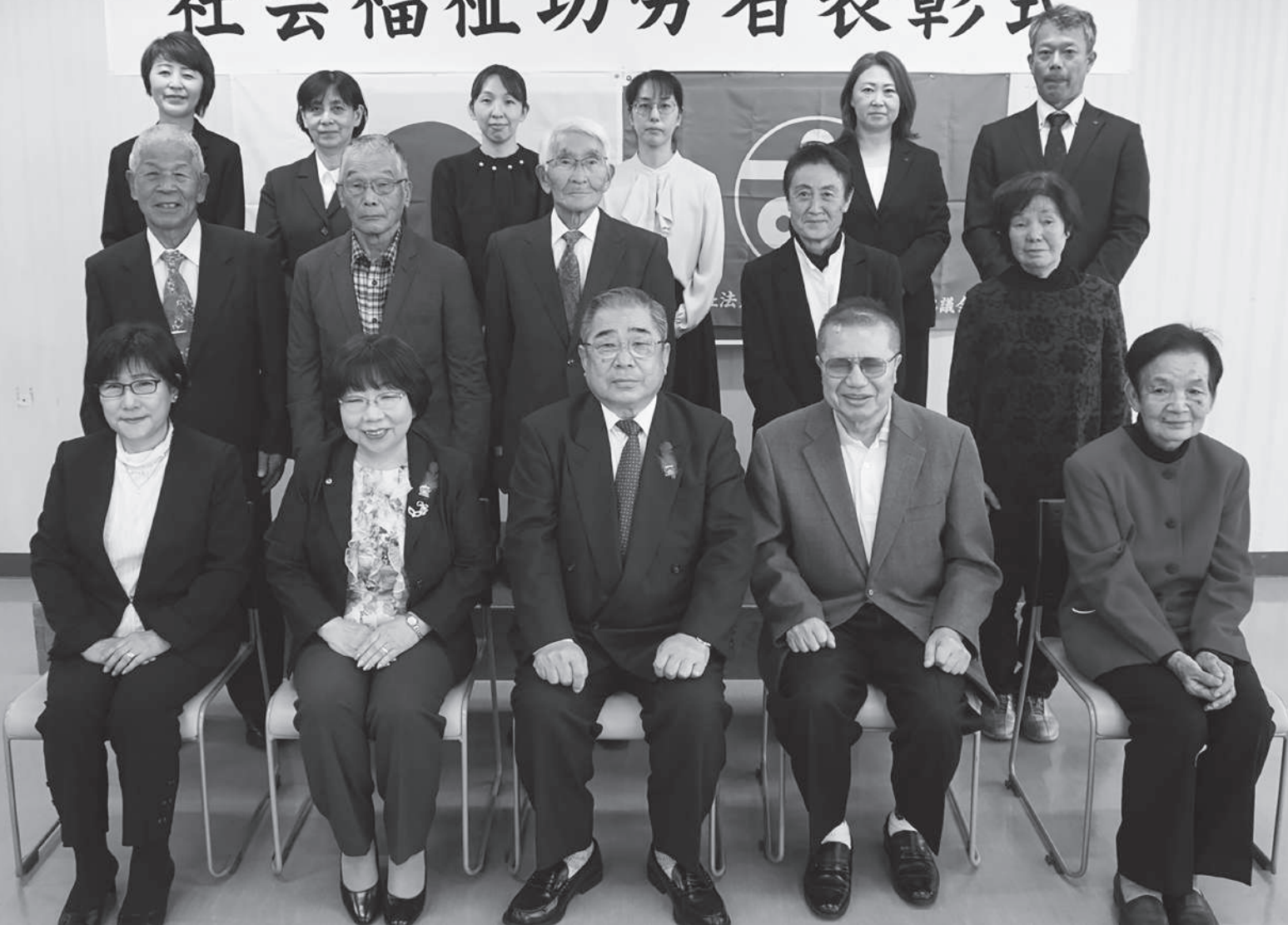
写真：社会福祉功労者表彰式