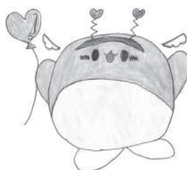
ふくてん 〈製作者〉栗中 そよさん