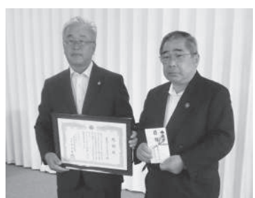
写真：岩見沢ライオンズクラブ 遊具贈呈式(平均台一式)

岩見沢ライオンズクラブ 古切手 遊具(平均台一式) 岩見沢グリーンライオンズクラブ 古切手 岩見沢市赤十字奉仕団 古切手 未使用切手