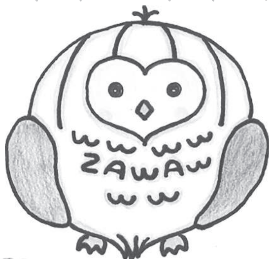
ざわたま 〈製作者〉三島 直人さん