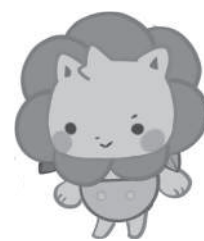
ロズ太 〈製作者〉渡 寛菜さん