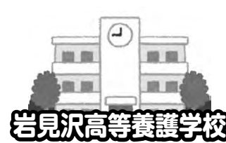
岩見沢高等養護学校