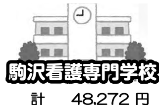
駒沢看護専門学校