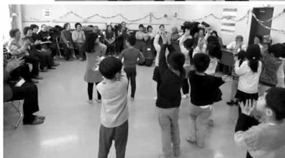
※2019年12月以前に撮影されたものです。