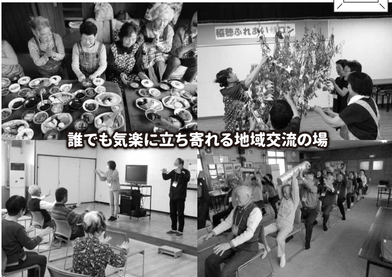
誰でも気楽に立ち寄れる地域交流の場