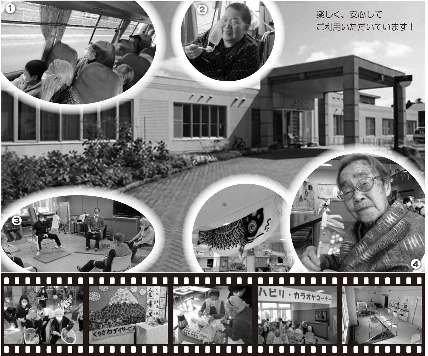
①車内からのお花見 ②ソフトクリームは黙食で ③座って無理なくセラバンド体操 ④お手製こいのぼりと一緒に