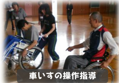
車いすの操作指導