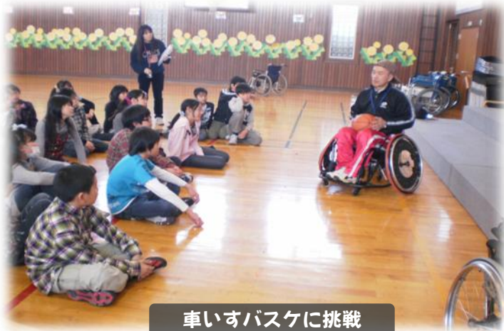
車いすバスケットに挑戦