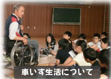
車いす生活について

また、車いす体験の際には、車いすの操作方法や乗り手の視点から介助する上での注意点などについてもお話しいただいています。